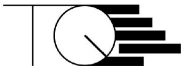
ブランドロゴ① (商標登録第 6284446 号) 本ブランドロゴは東急建設の登録商標です