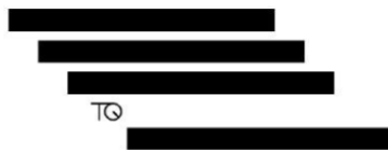
ブランドロゴ② (商標登録第 6284447 号)

※CASBEE ウェルネスオフィス評価認証 ( https://www.ibec.or.jp/CASBEE/certification/WO_certification.html )