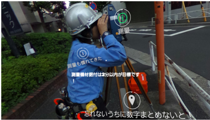
【測量業務の一場面】